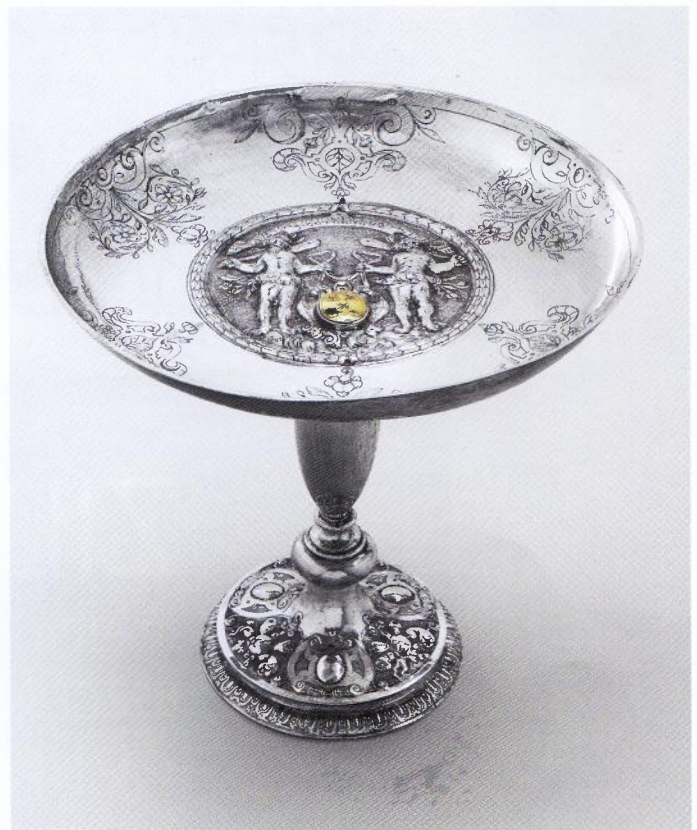
Geschiedenis in rijk gedecoreerd zilver: met vijf tazza's bedankte de stad Bergen op Zoom in 1622 degenen die - na een belegering van 86 dagen - de Spaanse vijand onder leiding van Spinola verdreven. Naast het stadswapen de twee wildemannen, erboven het motto, te vertalen als 'Door Gods gunst is Bergen overwinnaar'

Anders dan de meeste zilverscatalogi besteedt dit boek veel aandacht aan de 20ste eeuw. Zilver in en rond Bergen op Zoom behandelt de productie tot in de jaren 60, inclusief de vraagstukken die dat met zich meebrengt: vragen met betrekking tot de eigenhandige vervaardiging, de uniciteit, de doorverkoop, het aandeel van de machinerie en de opkomst van het onedele metaal. Drie generaties Andriessen zullen aandacht krijgen, evenals de zilversmeden bij Beckers Haardenfabriek (!) en de Gebr. Van Giels.