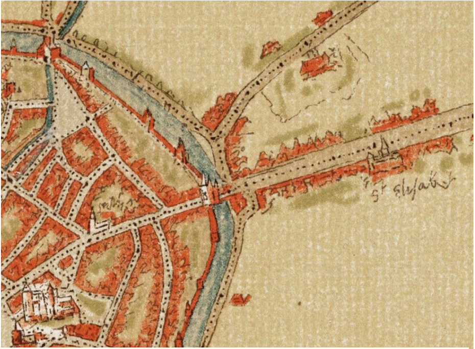
Detail van de kaart van Bergen op Zoom door J van Deventer anno 1560

Rechts is aan de weg het gasthuis St Elisabeth getekend. Deze weg heet thans de Oude Wouwse Baan WBA KG 073