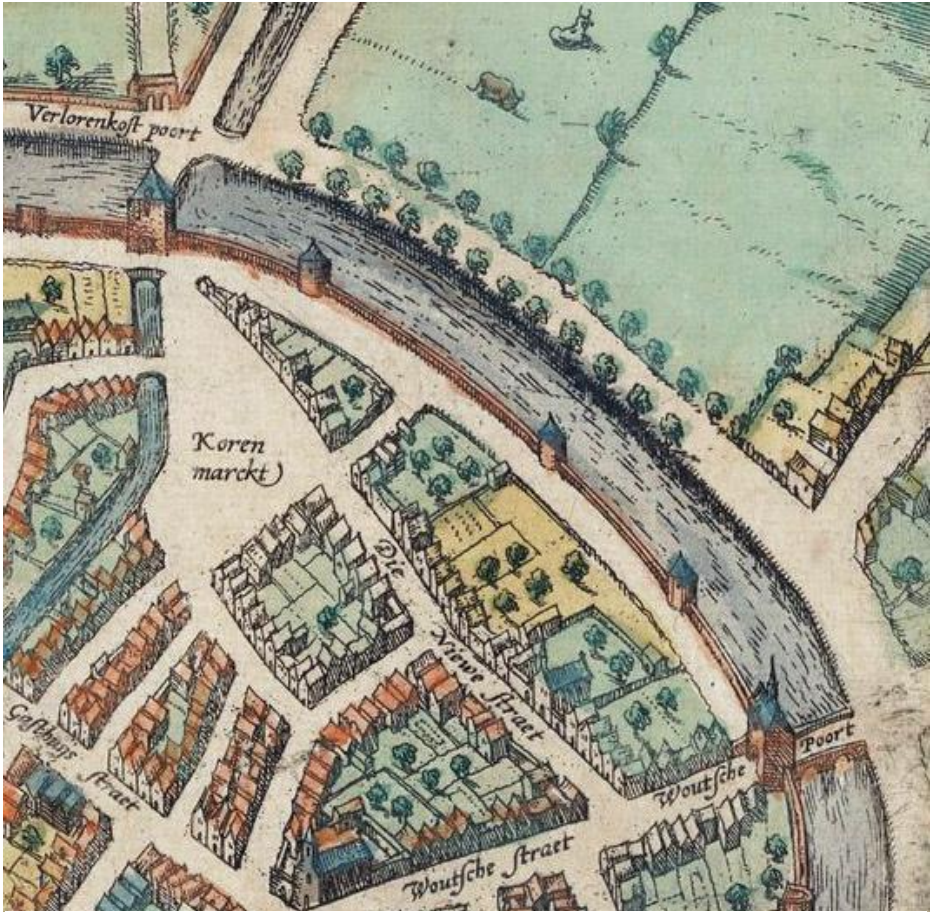
Detail van de kaart van Bergen op Zoom door Franciscus Hogenberg uit 1581 In de 'Nieuwe straat' is het gebouw met het blauwe dak de Cellebroederskapel. Linksboven is de Verloren Kostpoort of Begijnpoort te zien. WBA KG 074 B