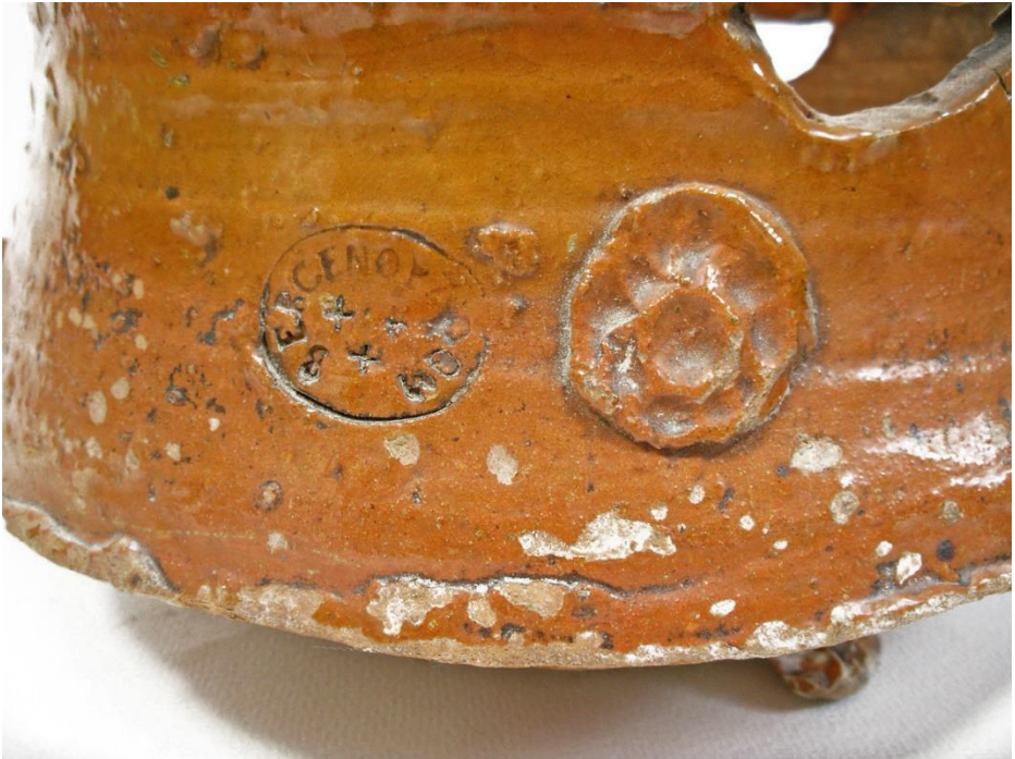
Keurmerk op het enige paginá hier voor afgebeelde komfoor