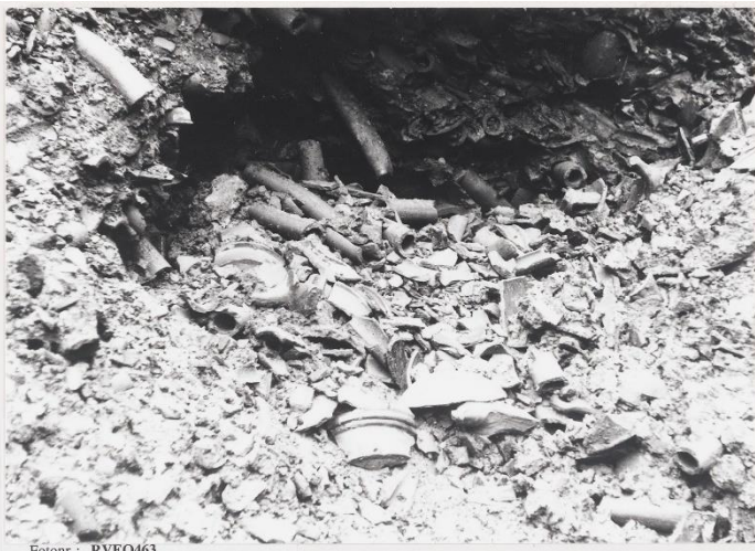
Stortlaag van misbaksels, opgegraven achter potterij De Rode Haan