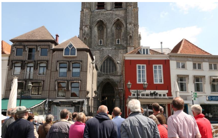
4 Links van het kerkpad heeft twee maal een brand zijn vernietigend werk gedaan

na ingaan van de nieuwe wet, 'slechts' 136 stuks waren. Bij de wetswijziging in 1905 (zwak alcoholische dranken) waren er in totaal 188 (108 sterke drank en 80 zwak alcoholisch). De eerste categorie was dus hoe dank ook, in aantallen gedaald. Het aantal van 188 vergunningen is er heden te dage niet meer. Of met deze afname ook de totale exploitatieruimte voor de horeca is verkleind valt te betwijfelen als je de huidige inrichting van de Grote Markt ziet, waar niet alleen de met gemeentegeld bekostigde vlakgeslepen trottoirs als horecavloer worden gebruikt, en het plein zelf geleidelijk aan steeds verder met terrassen volgroeit.