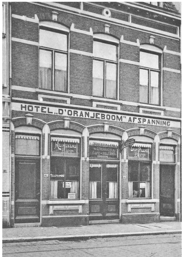
10 Links in het bovenvenster blijkt dat d'Oranjeboom vooral Heineken bier schonk