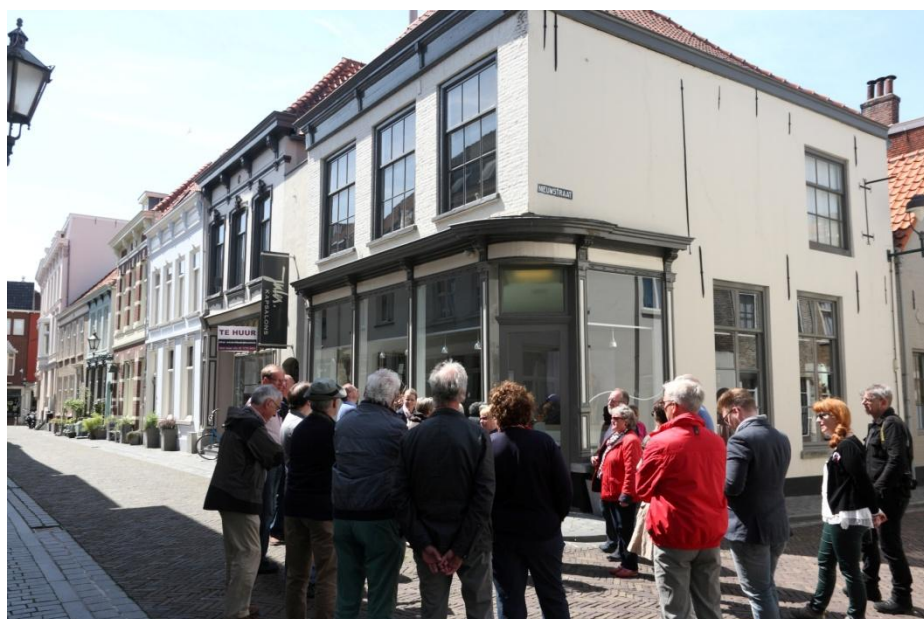
14 Tot 1938 was hier Bierhuis 'De Hoop' gevestigd