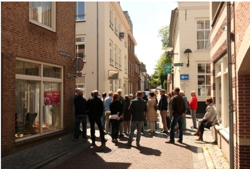
8 Van ToJobar/VIPS en café de Peperbus resteert slechts de herinnering