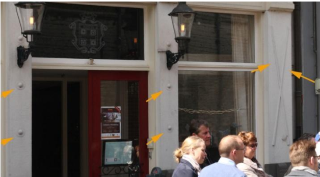
2 Biljartballen en keus zitten nog steeds in de gevel

Het begon al goed op het Beursplein, waar op de hoek Steenbergsestraat vroeger het Maastrichts bierhuis was gevestigd. Waarschijnlijk vernoemd naar het biermerk dat toen verkocht werd. Toen de term koffiehuis omstreeks 1910 uit de mode raakte werden vele van deze plekken omgedoopt in het (toen) deftiger klinkende 'café'. Met biljart, en met grotere bierglazen dan anderen, voor 15 ct per glas, dat dan weer wel, terwijl elders 12 ct voor een 'vaasje' werd gevraagd. De familie van Nijnatten begon in dit café in 1930 en verliet het medio 1988. Intussen was het Maastricht bierhuis in de jaren ' 50 veranderd in 'café Markiezenhof'. In hoeverre dat hielp om de in kazerne Prinsenhof (Markiezenhof) gelegerde militairen binnen te loodsen is niet bekend. Deze naam werd in 1999 veranderd in 'de Markies', omdat de bloemen, die voor het Markiezenhof bestemd waren, steeds weer in het café werden afgeleverd. Dat raakte men een beetje beu.