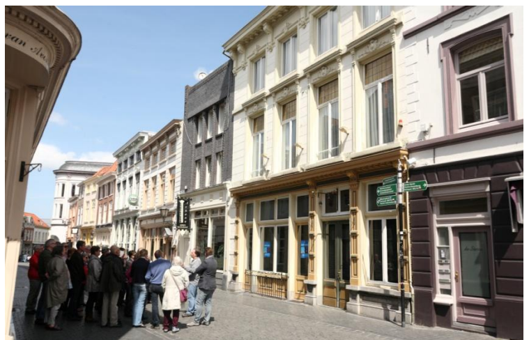
3 De Gouden Leeuw had vroeger een echte stoep met hek, waardoor er ruimte was voor een terras

In de Fortuinstraat (eerder Oude Potterstrate en Lange Meestraat) was op no 14 sedert 1893 het hotel 'De Fortuin' gevestigd in het pand van die naam. Later werd deze naam veranderd in 'Hotel de Gouden Leeuw', waarvan de naam nu nog zichtbaar is in het ijzeren hek dat tegen de gevel is bevestigd. Aardig detail is, dat herberg de Gouden Leeuw begin 20 e eeuw op de Grote Markt was gevestigd. Toen Frans Hazen ook dit pand overnam en er 'la Pidola' (vert: haasje over) als onderdeel van Hotel de Draak in vestigde, was de cirkel rond, omdat het pand daarmee net als 400 jaar eerder tot hetzelfde complex behoorde. Na de brand in de Draak op 26 februari 2013 kreeg de ruimte in het gebouw een andere bestemming in het Grand hotel