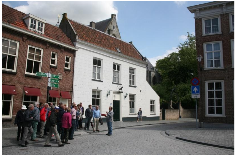
7 Waar was de Carillon bar? en de Piekskesbar?

Voort gaan we naar de Hoogstraat, waar op no 6 ook een café gevestigd is geweest. De Carillonbar kreeg zijn naam kennelijk omdat timmerlui die daar aan het werk waren de vraag kregen hoe het café ging heten, net toen het carillon begon te spelen, niet lang na hoefden te denken. Familie Konink-Melsen maakte van het café dé uitgaansgelegenheid, mede