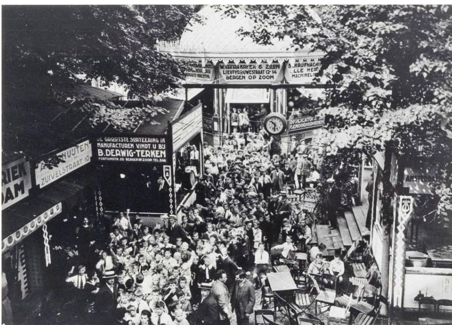
9 Het was druk in de Thaliatuin tijdens de tentoonstelling RIO in 1925