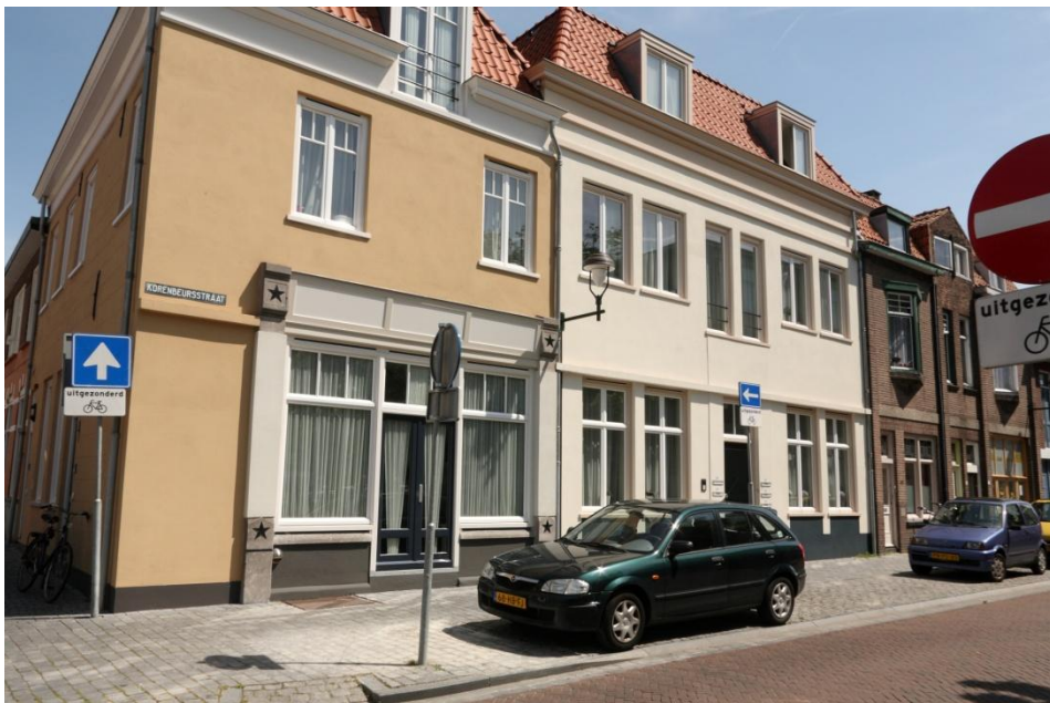
13 Alleen de Ster in de gevel is er nog

Een eindje verderop zien we op no 24 het pand waar vanaf 1963 tot 1972 De Zwarte Kat gevestigd was. De gevel is nauwelijks veranderd, ofschoon er wel een garagedeur in is gezet. (Ook weer Luyks) Een bewoonster die toevallig thuiskomt schiet in de lach als ze de deelnemers aan de kroegentocht met een blik vol warme herinneringen naar die nietszeggende gevel met garagedeur staan te kijken. Waarschijnlijk is ze niet op de