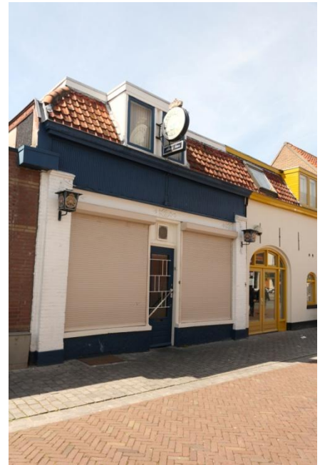
11 Zou die rijksdaalder er nog zitten?

Bij het passeren van het Korenbeursplein kan de Dikke Boom (gebouwd in 1915 door Wed. van Mansfeld) natuurlijk niet worden overgeslagen, een café met afspanning voor paarden. Later ontstond er een fietsenstalling met ruimte voor wel 1000 fietsen, à 10 ct per fiets een aardige bijverdienste. Hiervan gaat nog de anekdote als jongeren