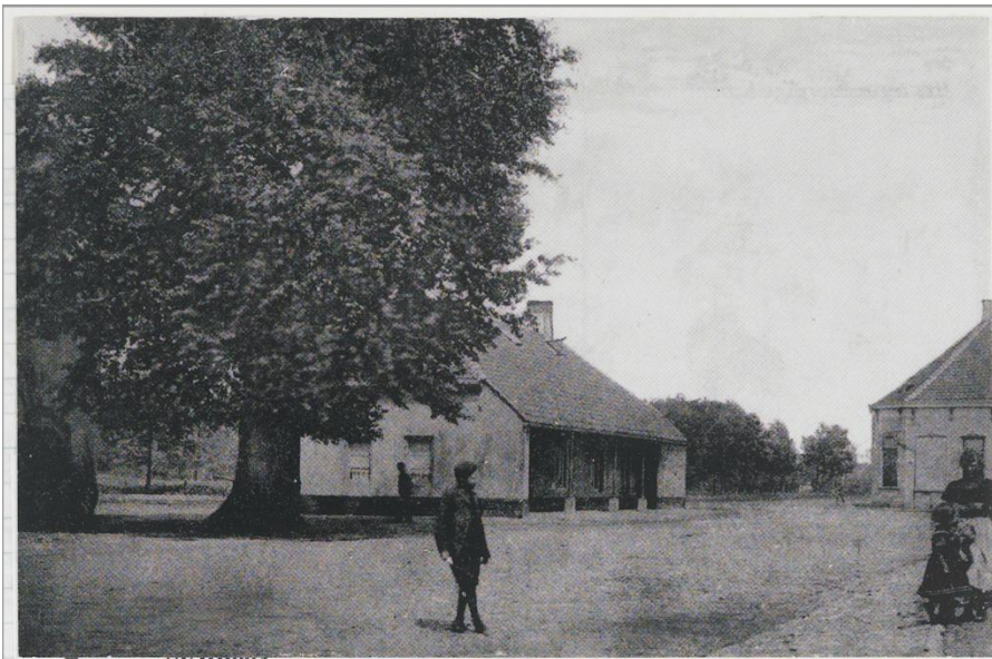
12 De dikke boom op het Korenbeursplein, omgewaaid in de stormnacht van 30 september naar 1 oktober 1911

toestemming vroegen voor gebruik van het biljart: "kunnen wij biljarten?" Eigenaar de Wit quasi antwoordde met "Dat weet ik niet"; hij had ze immers nog niet aan de tafel in actie gezien... Luyks heeft het gebouw thans als tegelopslag in gebruik.