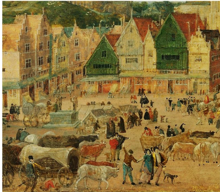
Grote Markt op een gouache van Hans Bol, 16 e eeuw

Bergen op Zoom groeide door zijn gunstige ligging aan de Schelde en het achterland uit tot een belangrijke handelsplaats, waar de bekende Paas- en Koudemarkten veel kooplieden vanuit heel Europa kwamen om producten te verkopen, en andere te kopen. Op deze markten was de handel in wollen stoffen als het Engelse laken en de daarvoor gebruikte kleurstof meekrap van groot belang. Soms werden deze kooplieden poorter van de stad, waardoor ze vrij waren van de betaling van tol voor hun