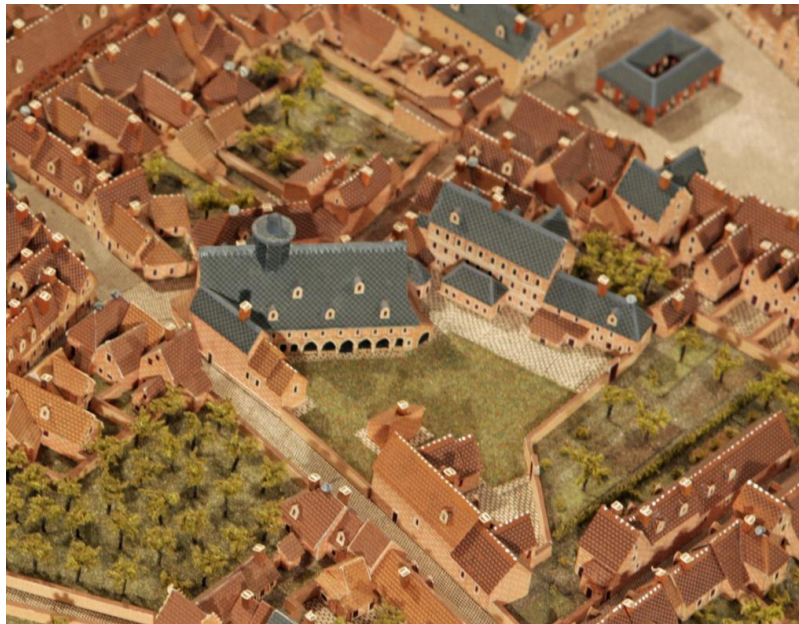
Lutheranen en Hugenoten kerken ieder in een eigen deel van de pas in 1952 gesloopte Margrietenkapel aan de Geweldigerstraat

Mede als gevolg van de personeelwisselingen in het garnizoen was er tot in de 18e eeuw een verschuiving van 10% per jaar onder de bewoners. Dat zie je niet zomaar aan de pure cijfers, daarvoor moet je de bevolkingsadministratie doorpluizen.