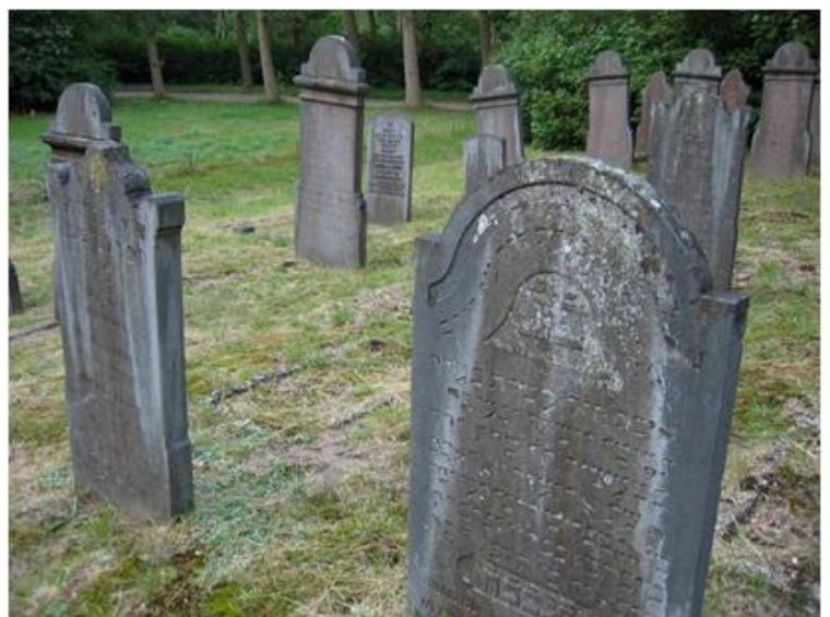
De Joodse begraafplaats aan de Herelsebaan herinnert aan de vroegere Joodse gemeenschap. Deze begraafplaats is thans eigendom van de Antwerpse Joodse gemeenschap

In 1815 kwam in Waterloo een einde aan de Napoleontische tijd. Heel Europa werd opnieuw ingedeeld. Zo ontstond het Verenigd Koninkrijk der Nederlanden. Maar niet voor lang. De Belgische Opstand in 1830 maakte hier een einde aan. Bergen op Zoom werd opnieuw een grensversterking.