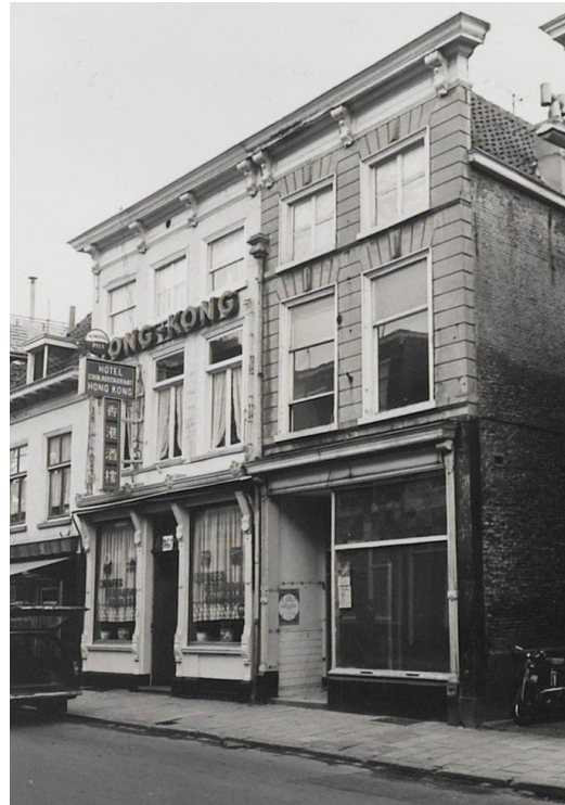
Het Chinese restaurant Hong Kong was in 1952 het eerste in de stad

Ook binnen Europa sloegen mensen op de vlucht voor het bewind in hun land. Te denken valt aan Hongarije (1956), Joegoslavië (jaren '90). De val van de Muur was een gevolg van een failliete economie en daarmee gepaard gaande vlucht van jonge Oost-Duitsers. De toenemende welvaart die ontstond na de heropbouw van het land deed een nieuwe vraag naar arbeidskrachten in de metaalindustrie ontstaan. De gastarbeiders, waarvan aanvankelijk gedacht werd dat deze maar kort nodig zouden zijn, kwamen uit Spanje, Griekenland, Marokko, Tunesië, Joego-Slavië. De gastarbeiders waren dermate langdurig nodig, dat hun gezinnen ook overkwamen en zich hier vestigden. De Nederlandse samenleving was voor velen vaak totaal andere wereld met onbekende normen en waarden. De integratie liep niet altijd even soepel.