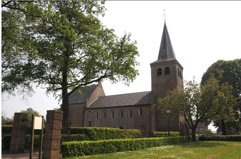
Het Romaanse kerkje in Eethen werd tijdens de oorlogshandelingen in 1944 zwaar beschadigd, maar werd minutieus terug opgebouwd. Daarbij werd ook gebruik gemaakt van teruggevonden oudere bouwsporen

In de latere middeleeuwen worden steeds meer en grotere kerken gebouwd. Veelal gotische gebouwen, uitingen van macht en welvaart. Concurrentie tussen steden en dorpen leidde tot een steeds verfijndere, rijkere vormtaal. De Mechelse steenhandelaren Keldermans bouwen door de eeuwen heen een waar imperium op, ze leveren ontwerpen en kant en