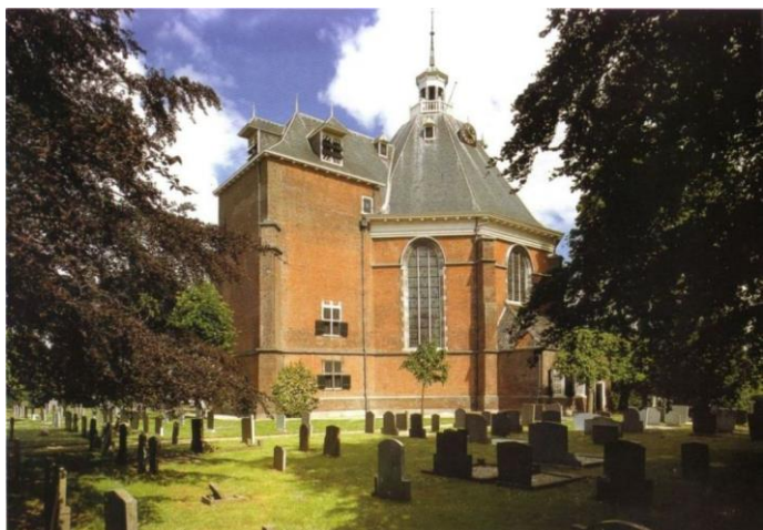
De achthoekige koepelkerk in Willemstad was de eerste voor protestantse eredienst bestemde kerk in Nederland

worden gebouwd in de vrije heerlijkheden van Boxmeer , Ravenstein , Uden en Megen . Ze zijn eenvoudig van buiten, maar weelderig van binnen. Dat geldt ook voor de schuurkerken en schuilkerken, waar vrijwel niets meer van over is gebleven. In deze ruimten beleefden de katholieken van de zeventiende en achttiende eeuw hun geloof, oogluikend getolereerd door protestantse regenten. Voor de kerkelijke interieurs van renaissance en barok zijn beleving en inleving in het lijden van Christus en de vele heiligen cruciaal. In bedevaartsplaatsen als Handel ontstaat een sacraal landschap met wegen, kapellen en een processiepark. Alles ademt hier devotie.