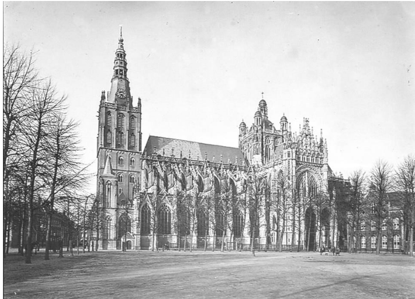
De St Jan in Den Bosch omstreeks 1920

Torens en kerken bepalen het aanzien van Brabant. Overal in stad, dorp of buitengebied rijzen ze op. Ze vertellen zonder woorden het verhaal van hun geschiedenis, van het bouwvak, van de kunsten en vooral van de gemeenschappen die ze ooit hebben gebouwd. Het zijn krachtige materiële uitingen van de Brabantse identiteit. In vervlogen