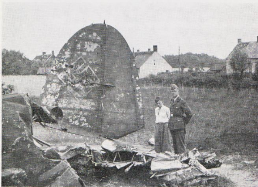
Het staartstuk van een op 12 mei bij het Pannenhuis neergestort Duits vliegtuig, vermoedelijk door Franse jagers neergeschoten.

In de vroege morgen van de 11de mei was de terugtocht van de Nederlandse leger-eenheden uit de z.g. Peel-Raamstelling begonnen 8). Deze troepen werden op de hielen gezeten door een in materieel opzicht superieure vijand. De aanvallen van de Stuka's (duikbommenwerpers) op de overvolle wegen vormden een ware verschrikking. De demoralisatie en de verwarring namen verbijsterende proporties aan 9). Deze vloedgolf van opgejaagd menselijk leed overspoelde onze stad vooral op die