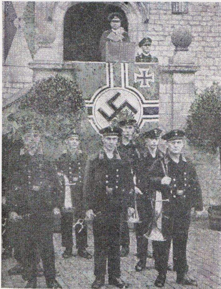
Een Duits generaal op het bordes van het Stadhuis tijdens een toespraak ter gelegenheid van de eerste beëdiging van marinerecruten die in Nederland plaats vond. Dat was in oktober 1940.

Deze schermutselingen hadden nog weinig te betekenen tegenover de harde tegenstellingen, zoals die zich later zouden openbaren. Overigens waren er toch wel mensen, die geloofden, dat de Duitsers zouden winnen. In dat geval was het gewenst, dat Nederland in het nieuwe Europa een zo goed mogelijke plaats zou verwerven. Uit deze gedachtengang werd in juli 1940 de Nederlandsche Unie geboren. De leiders ervan verkeerden in de mening met de Nazi-overheersers tot een compromis