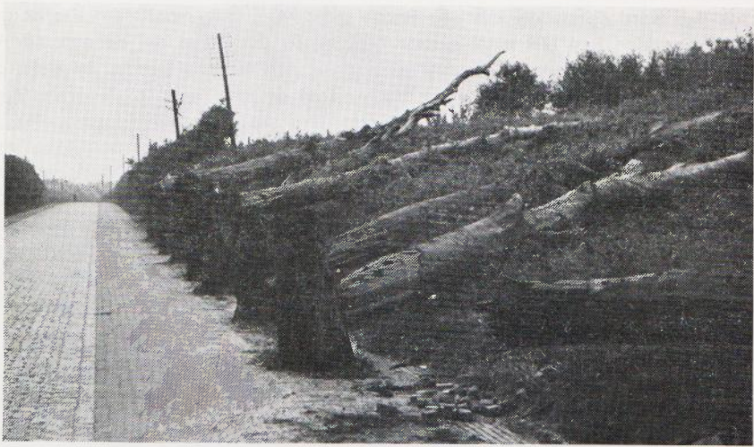
De vernielde bomen tussen Schaliehoef en Café Rens aan de Antwerpseweg nadat ze van de weg af ter zijde gelegd zijn.

In de morgen van de 10-de mei vertrok het grootste deel van het in en om onze stad stad gelegerde garnizoen. Dit bestond uit het 3-de grensbataillon 1). Het vertrek daarvan was volgens vooropgezet plan. Bij een Duitse aanval zou het genoemde grensbataillon ter beschikking komen van de commandant van de Vesting Holland 2). In verband met de landingen van Duitse parachutisten in Zuid-Holland werd