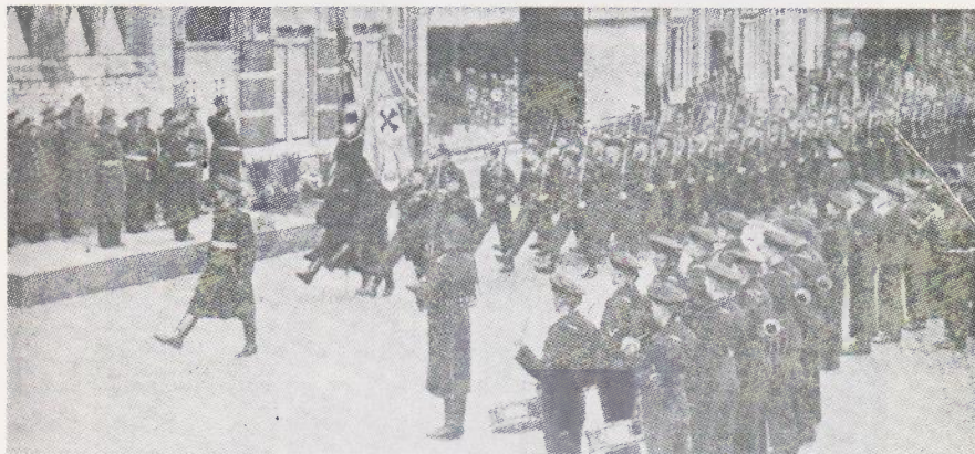
Het passeren der vaandels aan de kop van het défilé dat na afloop van de beëdiging plaats vond.

In de herfst van 1940 krijgt het optreden van de N.S.B.-ers een provocerend karakter. De uit hun mannelijke leden opgebouwde „Weerafdelingen” (W.A.) gaan georganiseerd de straat op. Onder de bewoners van onze stad ontluikt een zekere haat tegen deze zwart-geuniformeerde mannen. Op de 15de december 1940 komt het tot een uitbarsting. Op die zondagmorgen waren W.A.-mannen samengepropt in vee-wagens naar onze stad gereden. Zij waren afkomstig uit de verre omtrek. Bij hun mars door de stad ontstonden op verschillende plaatsen gevechten met burgers, die zich op het trottoir bevonden. In de marsroute was ook de Lievevrouwestraat opgenomen. Bij het kantoor van de Nederlandsche Unie werd halt gehouden, de ramen kapot geslagen en de deur geforceerd. Wederom op de Grote Markt teruggekeerd zijnde, zou een van de W.A.-voormannen een rede houden. Daar kwam weinig van