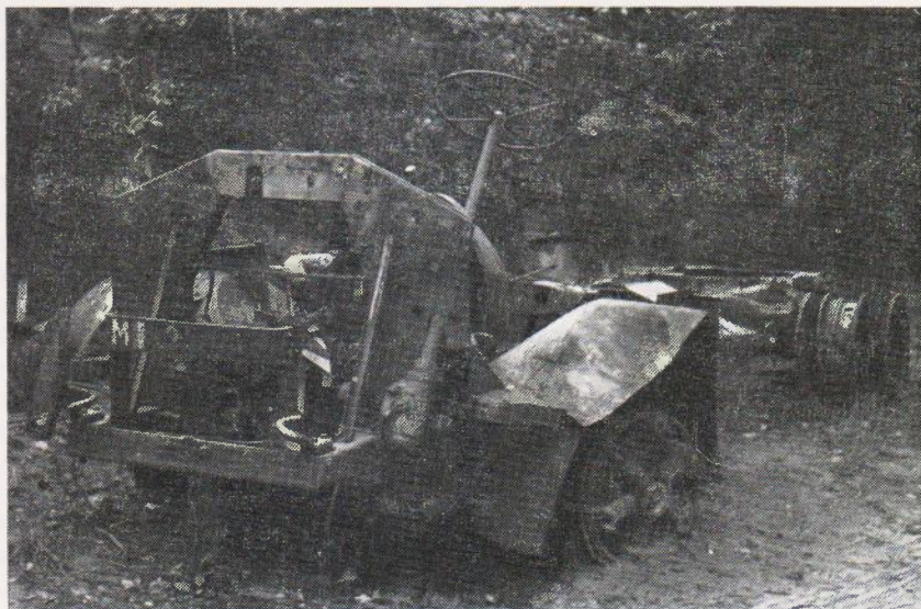
Een Franse militaire vrachtwagen op de Antwerpseweg vermoedelijk door een Duits vliegtuig in brand geschoten tussen Mattemburg en Korteven.

gedenkwaardige Eerste Pinksterdag. Bij menige Bergenaar zullen de droeve beelden hiervan in het geheugen gegrift staan. Eindeloze, maar dunne rijen militairen, veelal te voet, druppelden vooral via de Wouwseweg de stad binnen. Hun schoenzolen waren vaak doorgelopen; sommigen liepen zelfs zonder schoenen en de verschrikking der afgelopen dagen stond op hun ongeschoren gezichten te lezen. Telkens als er een vliegtuig overkwam zocht menigeen snel dekking langs de huizen. Van onze stad uit trokken zij verder naar Zeeland, waar zij gehergroepeerd en opnieuw bewapend zouden worden. Dat is er echter nooit van gekomen.