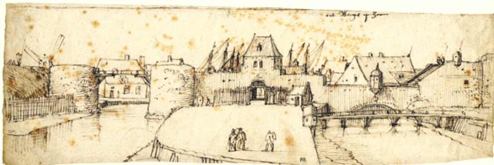
Afb. 3. Tekening van het havenfront van Bergen op Zoom gezien vanuit het westen met in het midden het Hamplein en de Hampoort (ook wel Waterpoort genoemd). Rechts daarvan de in 1447 gegraven haventak. Anoniem, midden 17 e eeuw.

In zijn Paas- en Koudemarkten stelt Slootmans dat het onduidelijk is hoe de heren van Bergen in staat waren om de economische positie van hun stad te beïnvloeden en te behouden. Zeker is dat zij uitvoerig gebruik maakten van hun contacten met het Bourgondisch-Habsburgse hof, waar zij diverse functies bekleedden. Tevens hadden zij de nodige internationale (diplomatieke) contacten. De heren van Bergen waren Engelsgezind en deden veel om de Bergse jaarmarkten te promoten. In 1459 werd heer Jan II zelfs gevraagd om een arbitragecommissie voor te zitten om een conflict tussen de Engelsen en Antwerpen te beslechten.