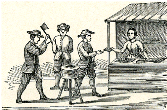
Afb. 5. Koekhakken was een behendigheids spel op de kermis.

De hervormde kerkenraad protesteerde regelmatig tegen kwakzalvers en het gokgebeuren. Soms vaardigde het stadsbestuur een verbod uit op gokken en behendigheids spelen, zoals koekhakken. Gokken was overigens in de meeste garnizoenssteden een probleem. Over het algemeen was het stadsbestuur niet tegen de kermis en na 1726 komt er geen protest meer tegen het kermisvermaak.