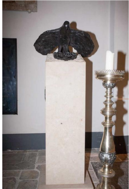
Monument in de zuidbeuk van de Gertrudiskerk naar een ontwerp van Nic Grosfeld

Ik hoop te hebben laten zien dat geschiedenis niet neutraal is, en dat het verschil maakt wie haar opschrijft. Voor Jan IV waren dat pastoors