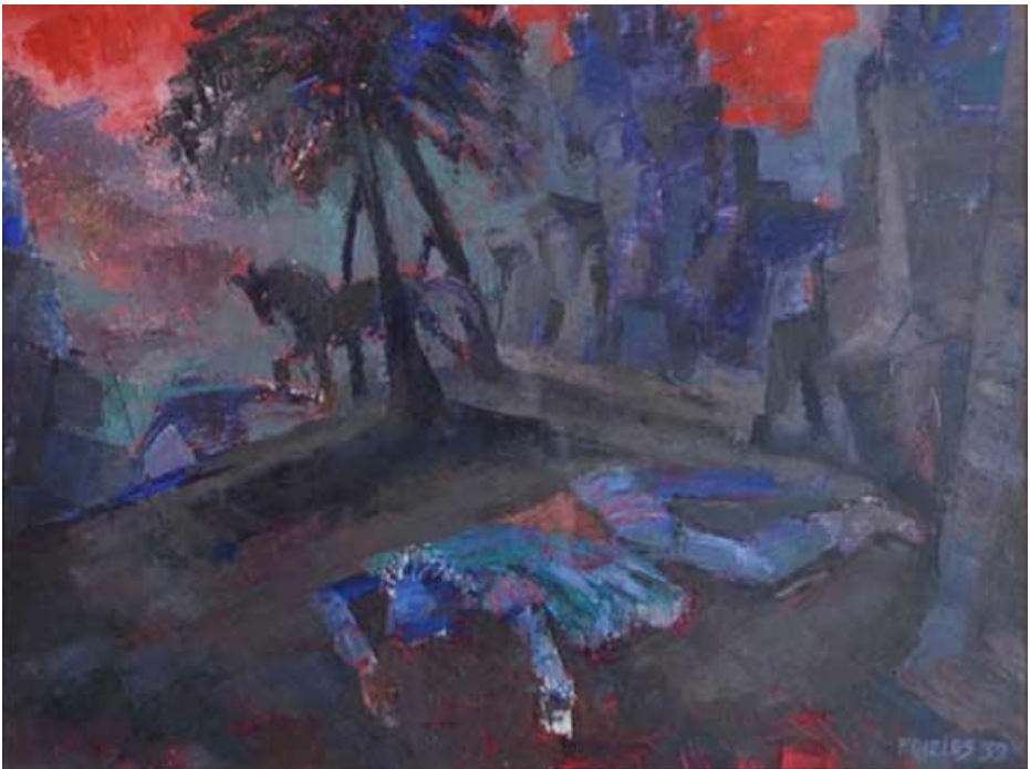
De dood van Jan IV van Glymes