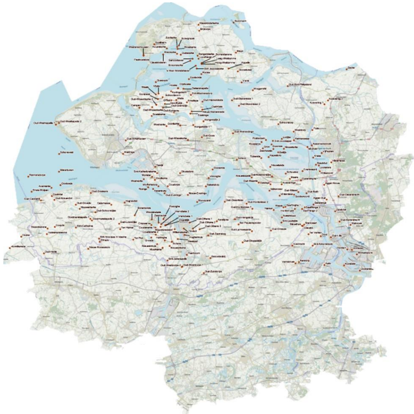
Een overzicht van verdrinken dorpen in de Schelde delta