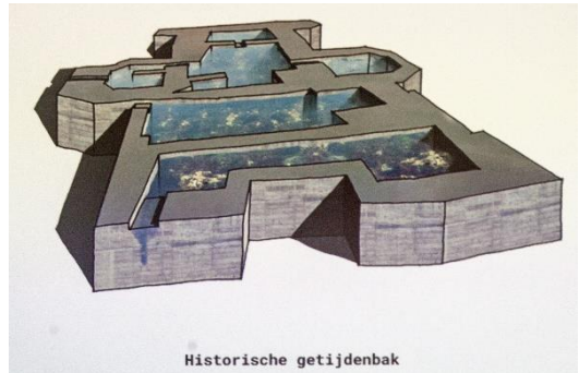
Getijdenbakken op de contouren van vroegere bebouwing

Op de Oesterdam wordt ter plaatse een informatiepunt ingericht, waar met informatie wordt aangeboden over het Geopark Schelde Delta, verdronken dorpen en de stad Reimerswaal in het bijzonder. Het 'Pompeii van Nederland' wordt hiermee voor bezoekers onder de