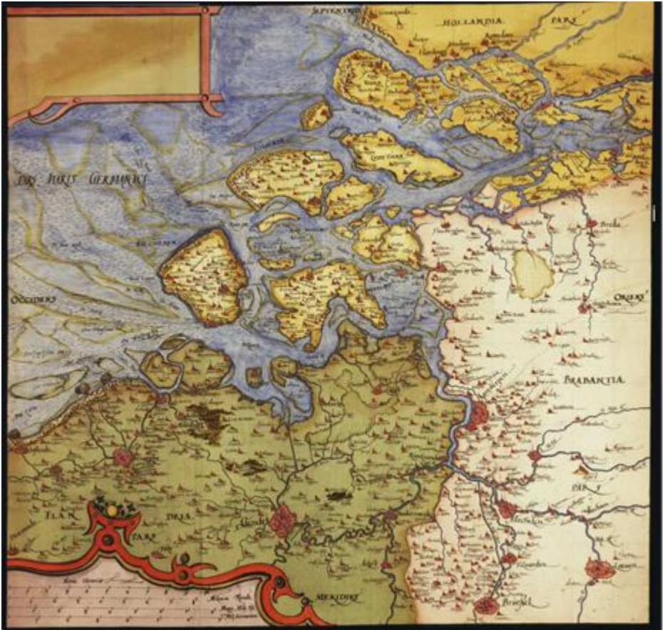
Kaart Zelandicarum door Sgrooten, 1573

Ook tegenwoordige bouwprojecten blijken soms onverwachte info op te leveren; bij de aanleg van een weg bij Biervliet bleek men dwars door een oud kerkhof heen te gaan.