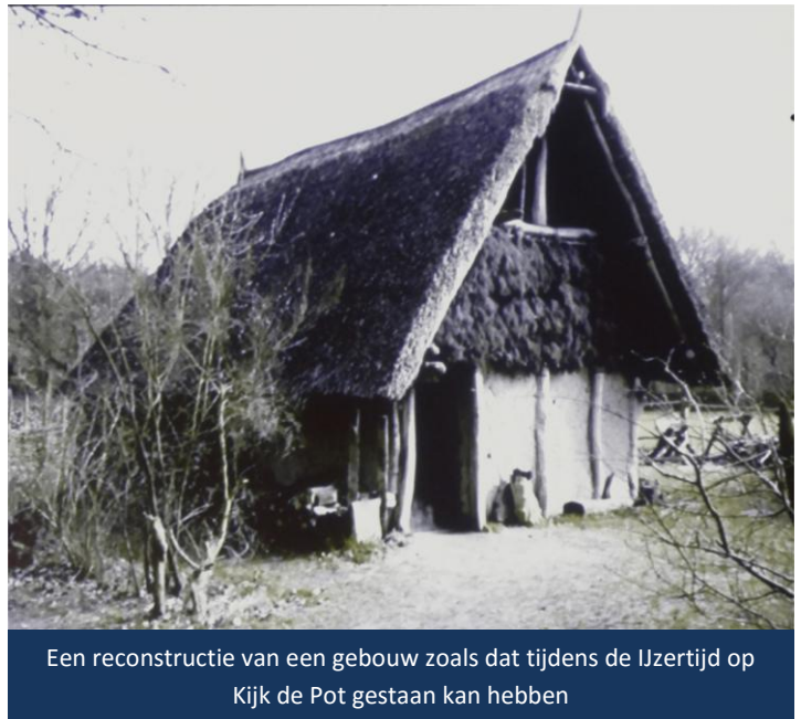
Een reconstructie van een gebouw zoals dat tijdens de IJzertijd op Kijk de Pot gestaan kan hebben

Ter hoogte van einde Zuidwestsingel werden zo'n 60 cm onder de oppervlakte zogenaamde paalsporen gevonden. Dat zijn verkleuringen in de bodem, ontstaan door inmiddels geheel vergane rechtopstaande palen die samen een gebouw vormden. Uit de gevonden sporen valt op te maken dat het hier om een bouwwerk ging van ongeveer 3 x 6 meter. Tezamen met op dezelfde diepte gevonden scherven is dit bouwwerk te dateren op 600-500 voor onze jaartelling, dus uit de Vroege IJzertijd. Het is daarmee het oudste gebouw wat tot nog