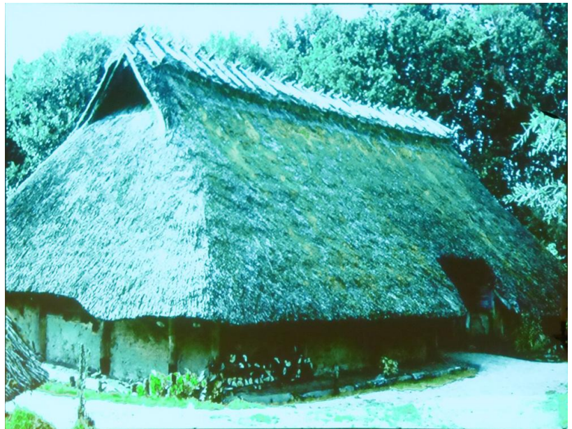
Reconstructie van een boerderij met potstal, analoog aan de paalsporen, ontdekt aan de Essenseweg in Nispen

De vondsten aan de Parade en Thaliaplein, het Romeinse offer-ven en onder de kerk (waarvan nooit een gepubliceerd onderzoek is verschenen) duiden er steeds meer op dat de oudste sporen van bewoning in dit gebied dateren uit de