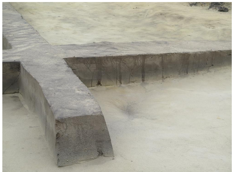
De grijze verkleuring is duidelijk zichtbaar in een overigens veel bruinere bodem. In het ontgravingskruis zijn de paalsporen zichtbaar.

boven: o.a. een fibula, een geelglazen haarring en een stuk van een maalsteen, bestaande uit vuursteen uit het Duitse Nederrijngebied, voorzien van groeven zoals op een maalsteen gebruikelijk zijn. Deze vondsten brengen de periode waarop deze boerderij in gebruik was op de 2 e eeuw van onze jaartelling. Dit strookt weer met de Romeinse vondsten in Bergen op Zoom (Kijk in de Pot en Thaliaplein).