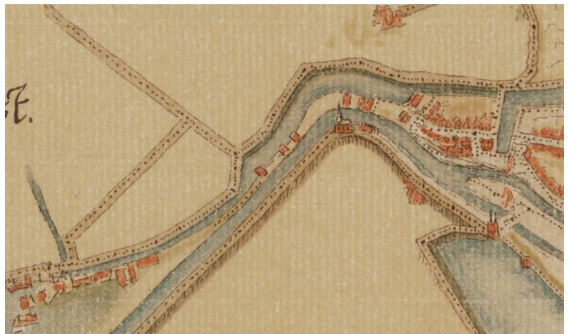
Detail uit een kaart van Jacob van Deventer anno 1560 toont de situatie vóór de aanleg van de vesting

10 e – 11 e eeuw van onze jaartelling. In het ven zijn 4 lagen met sporen te onderscheiden, waarvan de oudste stukken van een haarkam bevatte uit de 10 e tot 11 e eeuw. Ook een munt die gevonden werd aan de Zuidmolenstraat dateert uit die tijd (gemunt met kop van Otto II) Aan de Kloosterstraat werden onder de gesloopte Antoniuschool zowel sporen gevonden van een gracht als van 2 huizen, waarvan de paalsporen middels de C14 methode zijn te dateren op 1030-1210. Tezamen met de kerk betreft dit mogelijk het veelgemaelde bezit van het klooster van Nijvel, en vormt daarmee ook het begin van de bewoning in Bergen op Zoom.