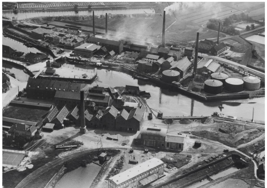
Deze luchtfoto uit 1924 toont hoe vol het gebied stond met fabrieksgebouwen. Eigenlijk opmerkelijk dat er nog oude sporen te vinden waren.

terrein slechts één stukje onverstoorde middeleeuwse grond over: langs het Smitsvest. Een eerste proefsleuf leidde meteen tot teleurstelling, omdat deze al de volgende dag bleek volgelopen met olie uit de omringende bodem. Toch zijn er interessante vondsten gedaan in het gebied achter het groot Arsenaal. Op een diepte van 2 m kwamen sporen van een huis en zelfs een stukje bestrating tevoorschijn, dat uit plm 1500 stamt. Het was gelegen op een ophoging van zel-as.