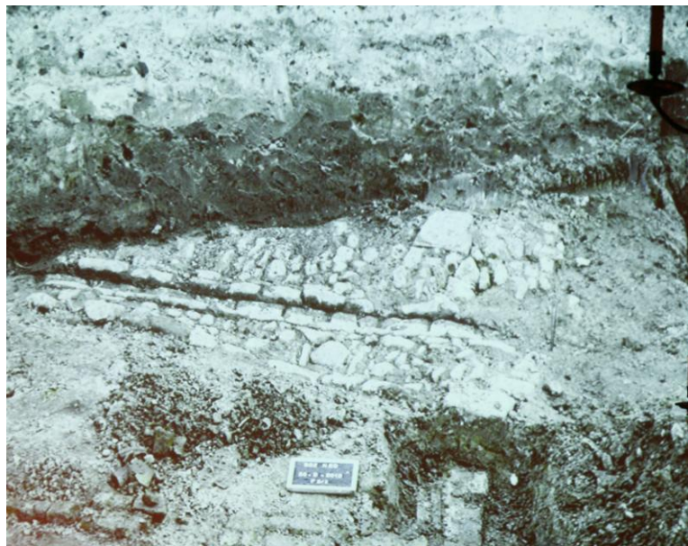
Een stukje middeleeuwse bestrating, ontdekt op 2 m onder het oppervlak

Bij de ontgraving van de vestingdelen werd overigens de tenaille van Dun voor een groot deel teruggevonden; deze snijdt dwars door het middeleeuwse vlak heen. Ook van Gadellière bleek een veel groter muurdeel dan wat zichtbaar was aan het Smitsvest nog intact; het verdedigingswerk loopt bijna door tot achter het groot Arsenaal. 7)